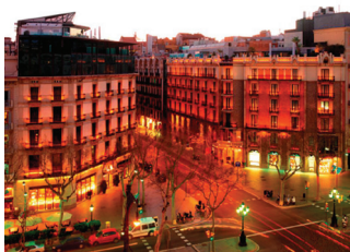
Hotel Condes de Barcelona Passeig de Gràcia, 75 · 08008 Barcelona