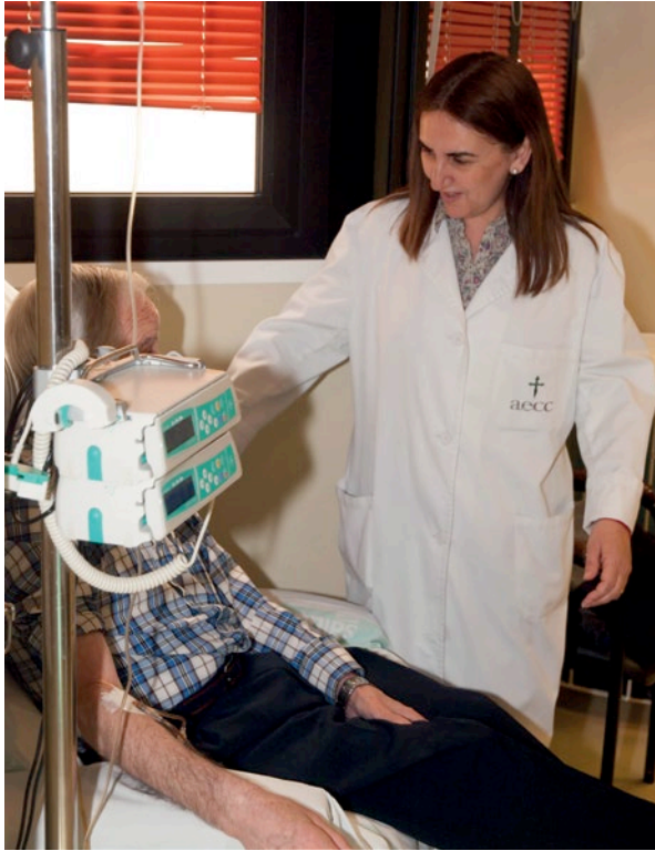
Acompañar a los pacientes, una prioridad para la AECC