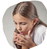
Náuseas y vómitos