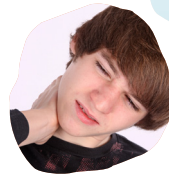
Rigidez de nuca